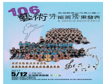
5月12日音樂舞蹈班將於文化中心演藝廳成果展演。