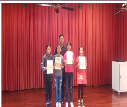
全縣兒童節歡樂兒童漫畫比賽頒獎。