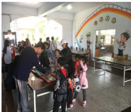
愛心玩遊會--本土語闖關。