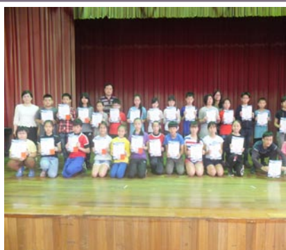
『一張相片的故事』比賽頒獎。