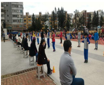
辦理慶祝兒童節舉辦跳繩個人比賽。