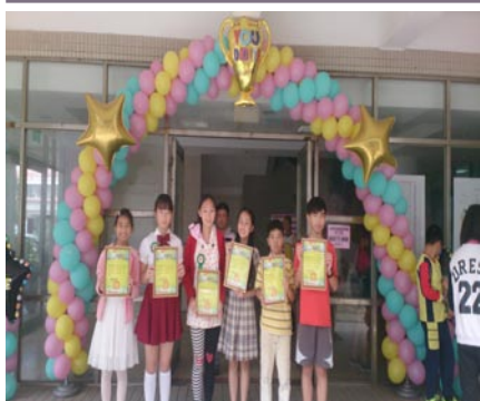
全縣模範兒童表揚活動。