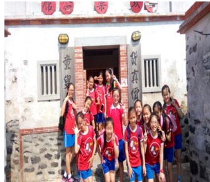
校外教學--四年級二崁村古厝。

總而言之，做好個人防護，時時注意周遭環境之衛生條件並減少積水，減少蚊蟲孳生，乃是避免感染登革熱的不二法門。