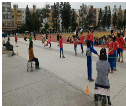
辦理慶祝兒童節舉辦跳繩團體比賽。