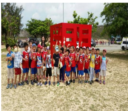
校外教學--一年級臨門沙灘