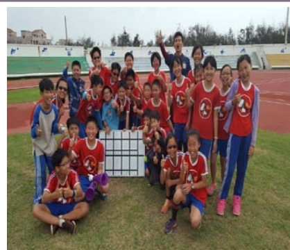
五年三班參加全縣樂樂棒球賽榮獲冠軍。