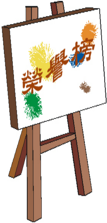
中華民國第48屆 世界兒童畫展- 澎湖縣入選（複選）名冊