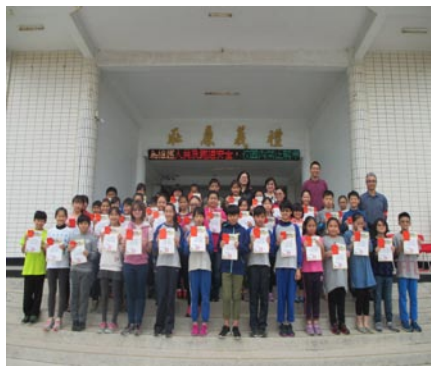
頒發寒假作業優秀者獎狀。