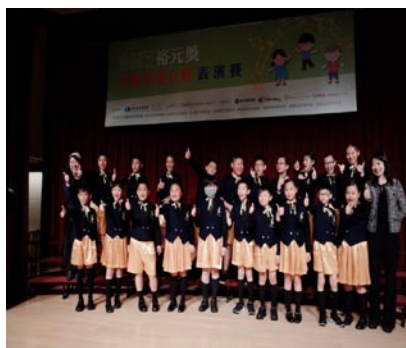
合唱團參加台中裕元獎表演賽。