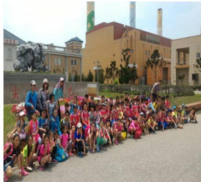
校外教學--三年級尖山發電廠