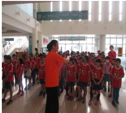
校外教學--二年級參觀文化局圖書館