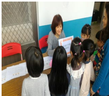
愛心玩遊會--護士阿姨健康宣導。