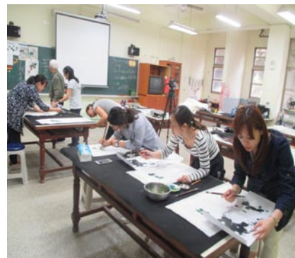
教師水墨畫研習增能。