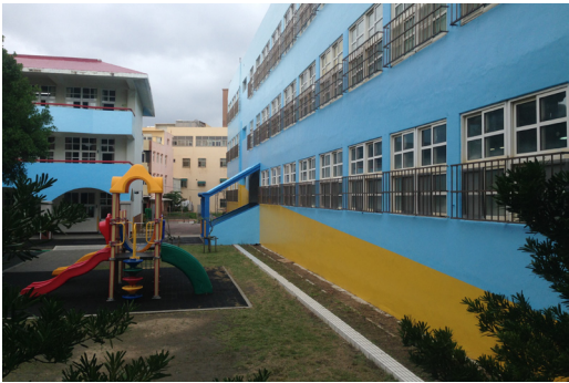
一棟教室外牆粉刷工程已完成，煥然一新。