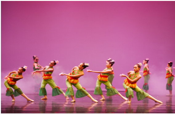
4月24日藝術成果發表會四舞五舞—花兒舞娉婷。