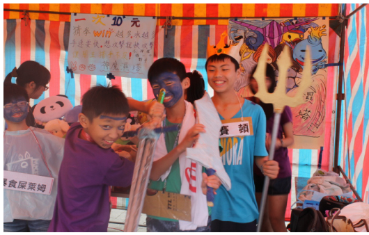
4月1日本校舉辦愛心玩遊會。