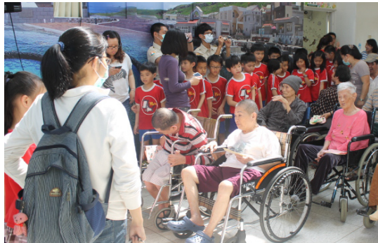
三年級戶外教學—老人之家。