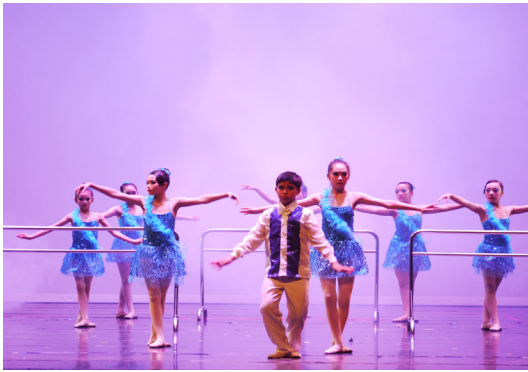
4月24日藝術成果發表會六舞—芭蕾。