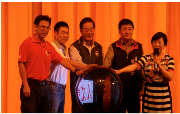
4月24日藝術成果發表會縣長會長校長一起開啟夢想舞臺。

教務處於4月1日愛心玩遊會擺設科學、英語、本土語等闖關攤位，體驗科學遊戲以及驗收語文教學成果，更設有好書交換活動，今年響應的家長較