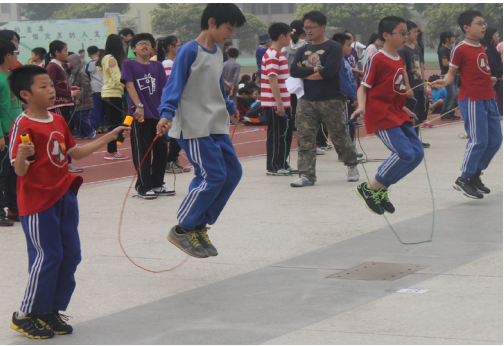
本校辦理慶祝兒童節舉辦跳繩比賽。

103學年度藝術才能班入學鑑定起跑囉！報名展延至5/16，舞蹈班鑑定時間為6/8上午，歡迎喜愛舞蹈的小朋友加入馬小舞蹈班的行列，一起學習成長！