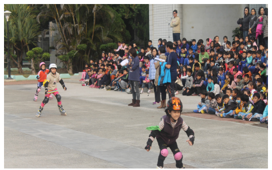
本校慶祝兒童節舉辦直排輪競速比賽。