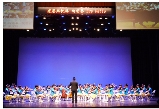
4月24日藝術成果發表會音樂班一管絃合奏。