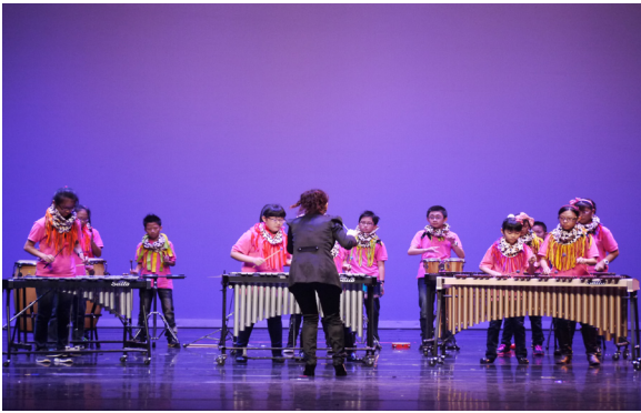
4月24日藝術成果發表會打擊樂隊表演。