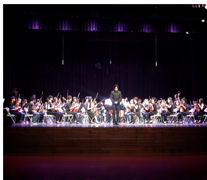
10月3日音樂班參加—104年澎湖縣傑出演藝團隊聯合公演—精彩演出！