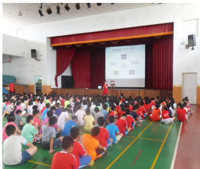
友善校園週—校長於活動中心針對校園反霸凌、友善校園主題進行宣導。