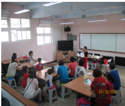
社區多功能活動中心—環保香皂製作班，學員專心聆聽老師講解。