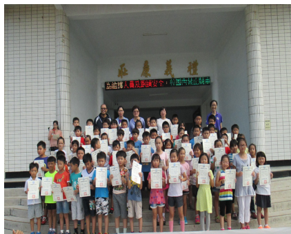
澎湖縣第九屆經典會考，榮獲國小團體甲組第一名，選手與校長和師長一起合影留念。