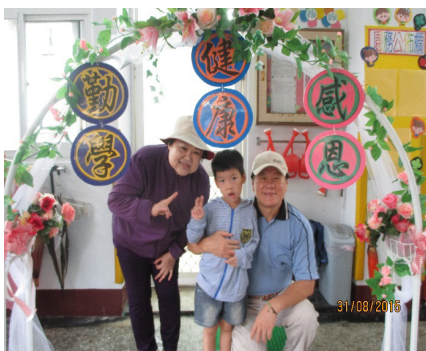
祖父母節活動—小朋友與阿公和阿嬤開心合影。