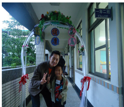
8月31日新生入學—小朋友與家長在教室前開心合影！