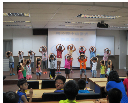
臺灣藝術大學駐校營隊—結業暨成果發表！