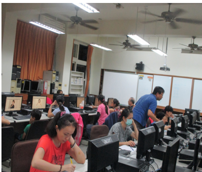
社區多功能活動中心—資訊班，學員認真學習實際操作。