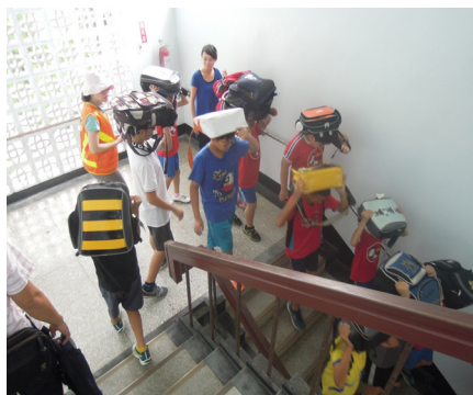
9月21日防震教育演練，小朋友依序下樓，聽從指揮老師疏散。

指揮中心呼籲，清除病媒孳生源才是防治登革熱最根本的方法，個人外出應做好防蚊措施，穿著淺色長袖衣褲、並使用衛福部、環保署核可之防蚊藥劑；如有發燒、頭痛、後眼窩痛、肌肉關節痛、出疹等登革熱疑似症狀，應儘速就醫，並告知醫師旅遊或活動史，以利及時通報與治療。民眾若經醫師診斷可能感染登革熱，請遵照醫師指示服藥、在家休息、多補充含電解質的水分，並做