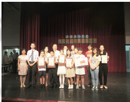
全縣國語文競賽榮獲國小團體組第三名，選手與陳縣長和師長一起合影留念。