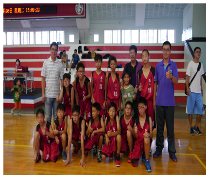
本校籃球隊選手在教練群辛勤的指導下，獲得縣運籃球錦標賽第一名，開心地合影。