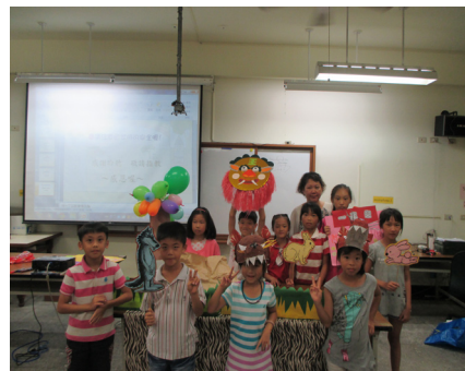
暑假閩南語說唱藝術營—學員開心一起合影。