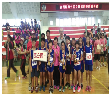
本校田徑選手於縣運比賽榮獲佳績，獲獎小朋友與教育處許處長和師長合照留影。