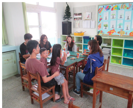
家長與老師進行雙向互動，親師溝通可以幫助孩子在學校學習或生活上更適應、更快樂。