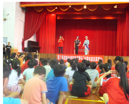
9月18日國立臺灣戲曲學院蒞臨本校進行演出及教學，學生專注聆賞對戲曲有更進一步了解。

好防蚊措施，避免被蚊蟲叮咬，以減少病毒藉由蚊蟲散播；如出現持續嘔吐、嚴重腹痛、呼吸困難、出血、四肢冰冷濕黏或意識狀態改變等警示徵象，應立即回醫院就診，以降低重症及死亡風險。相關資訊請參閱疾管署全球資訊網 ( http://www.cdc.gov.tw ) 或撥打國內免費防疫專線1922（或0800-001922）洽詢。 五. 學校配合衛生所於10/22實施流感疫苗施打。