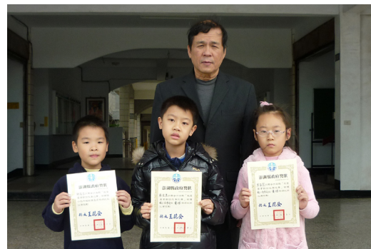
全縣我愛圖書館說故事比賽轉頒獎。