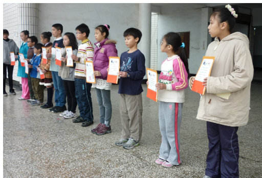
校內語文競賽頒獎。