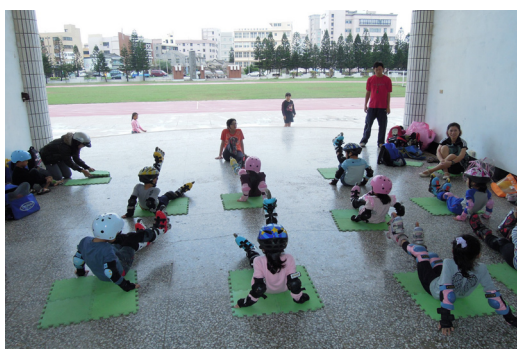
直排輪初學班邀請志工教練進行練習。