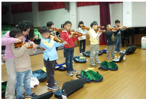
本校二年級弦樂基礎養成班上課情形。