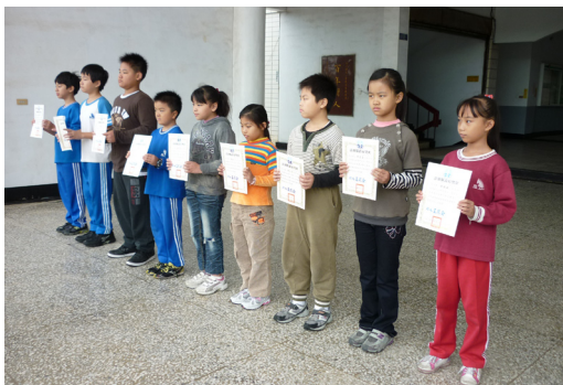
全縣資訊應用競賽轉頒獎。