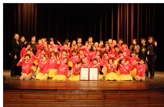
本校學生參加音樂比賽獲合唱「特優」、管絃樂合奏「優等」佳績。