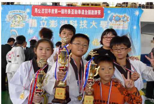
本校學生參加市長盃跆拳道全國邀請賽。

12/26舉辦本學期期末術科評量，同學們展現這學期的術科學習成果，希望同學們再接再勵，也感謝各位老師的辛勤指導。