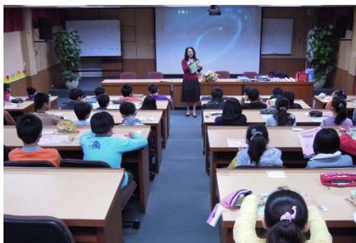
12/14稅捐處蒞校針對六年級同學進行租稅教育。