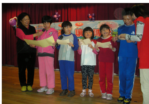
與天使有約一愛讓心靠近將祝福獻給我們的大家長王縣長，由縣長夫人代表接受。